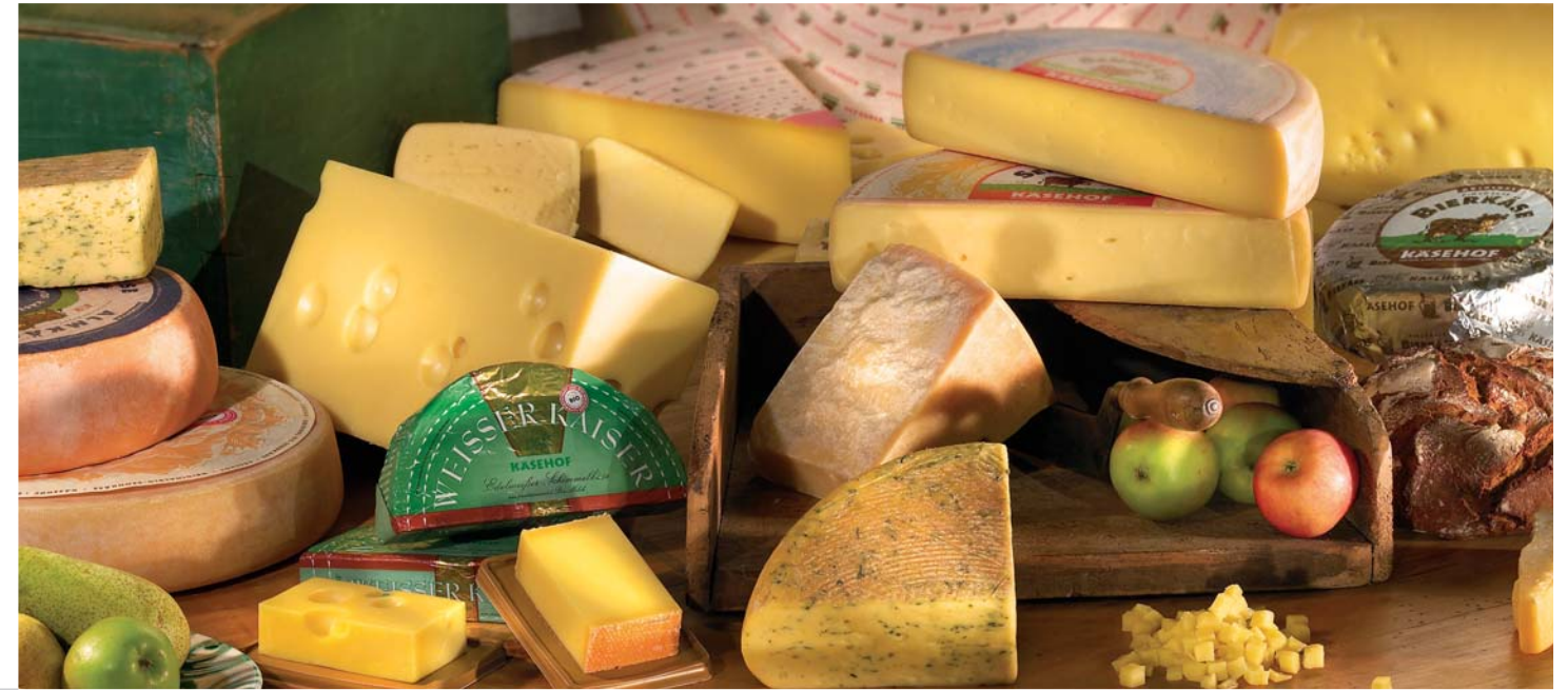
Das Käsehof Produktsortiment

Käsehof in Seekirchen im Salzburger Land hat ihren Ursprung in der 1935 gegründeten Käserei-Genossenschaft Seekirchen. 1996 wurde die Marke Käsehof kreiert, um ausgewählte, natürliche Rohstoffe nach alter Tradition zu Käse von absoluter Reinheit und erstklassiger Qualität zu verarbeiten – und so unter den Großen bestehen zu können. Käsekenner verbinden die Gegend um Salzburg mit der Marke Käsehof, mittlerweile einem der größten Heumilch- und Biokäse-Erzeuger Österreichs. Zusätzlich entstand unter dem Namen Hapack ein hochmodernes Abpackunternehmen und die Salzburger Käsewelt, Österreichs erste Bio-Schaukäserei. Käsehof beliefert heute den gesamten österreichischen Lebensmittelhandel und exportiert mehr als die Hälfte seiner Produktion nach ganz Europa.