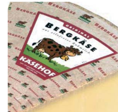
Die Käsehof Kuh als Sympathieträger

Denn diese geben sich lange nicht mehr mit „jedem Käse“ zufrieden, sondern wollen sich mit dem Produkt, das sie essen, identifizieren können. Käsehof liefert mit seinem Markenauftritt eine überzeugende Antwort. Die Marke selbst bietet einen verlässlichen, ehrlichen