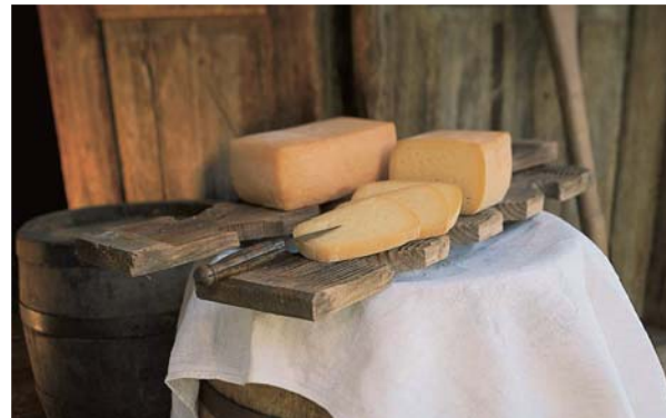
Der Original Pinzgauer Bierkäse von Käsehof